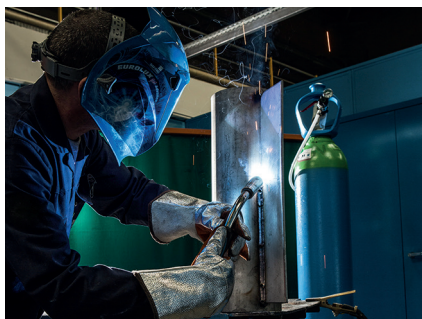
Soudage MAG de l'inox

La solution gaz de protection haute performance pour le soudage MAG de tous les aciers inoxydables