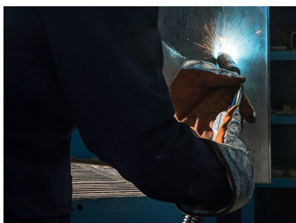
Soudage toutes positions