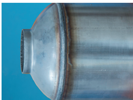
Pot d'échappement en inox ferritique

ARCAL™ Chrome vous garantit une qualité constante et une utilisation en toute simplicité, quelles que soient les quantités dont vous avez besoin, de la bouteille jusqu'au liquide